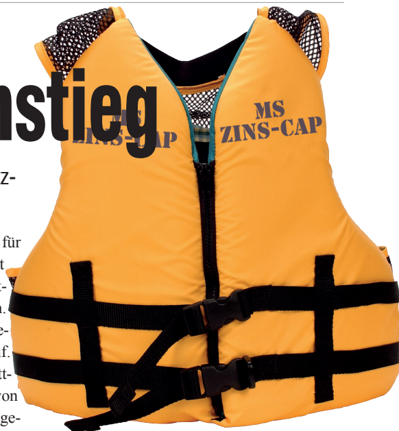
Zins-Caps schützen bei einem Zinsanstieg.

Jahren etwa auf 5,5 Prozent, dann zahlt der ungeschützte Kreditnehmer monatlich fast doppelt so viel wie der Zins-Cap-Besitzer.